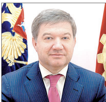
Отвечает глава городского округа Балашиха Ю.В. Максимов:

Вопрос: Просим принять во внимание многочисленные (3116 подписей) замечания жителей мкр. Заря при разработке Генерального плана городского округа Балашиха. Исключить из Генерального плана: жилую многоэтажную застройку на месте лесного массива, капитальное строительство вблизи водоохранной зоны, организацию перехватывающей парковки внутри жилой зоны, возведение торгового центра напротив ГСК «Восход» и строительство поликлиники за озером. Запланировать капитальный ремонт канализационного коллектора, строительство подземного пешеходного перехода на платформе Заря, детского сада на 650 мест в городской черте, организацию системы стока поверхностных вод, расширение рекреационной зоны. Провести благоустройство территории с организацией детских площадок, спорткомплексов, реконструкцией уличного освещения. Отремонтировать дороги и организовать пешеходные зоны, а также обустроить новый парк отдыха. Просим провести предварительное обсуждение нового Генерального плана с жителями микрорайона.