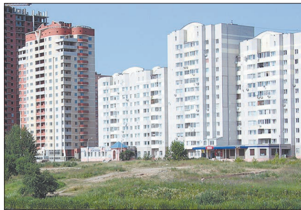
Постановления Правительства РФ № 354 от 06.05.2011 года.

Также одним из не менее важных этапов досудебной претензионной работы с неплательщиками ЖКУ являются мероприятия договорной ответственности, проводимые ООО «ИРЦБ». Меры договорной ответственности включают в себя начисление пени и отключение либо ограничение предоставления коммунальных услуг в рамках