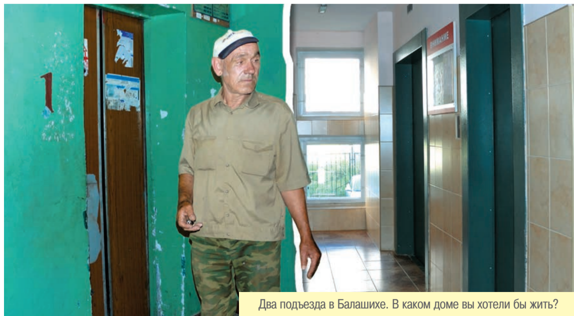
Два подъезда в Балашихе. В каком доме вы хотели бы жить?

Читайте в рубрике «Союзники» на стр. 2–3